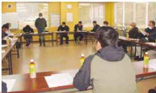
出荷協議会の様子

令和6年産は1月中旬から1月末に収穫し、約37トンの出荷を計画。1月中旬から県内を中心に東京、大阪に出荷され、2月中旬まで続く予定です。