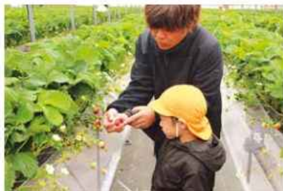
いちご狩りを楽しむ園児