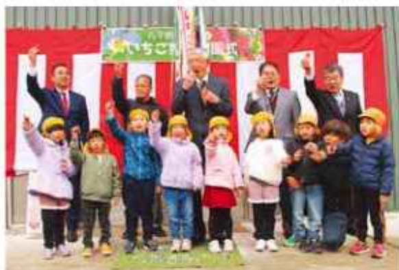
いちごの乾杯で開園を祝う参加者