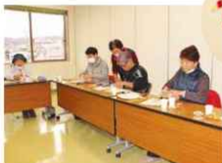
風車作りを行う女性部会員

資源の再利用、自然の風を利用したSDGsの取り組みを今後も展開していく予定です。