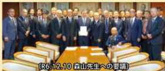
(R6.12.10 森山先生への要請)

また、甘味資源作物対策では、生産者交付金が甘しょで+2,010円/tの引き上げ、さとうきびは引き下げ議論があったものの、前年と同額が維持されました。我々の要請内容をしっかり受け止めていただいた森山裕先生や野村哲郎先生をはじめとする県選出国会議員の先生方のご尽力により、我々の主な要請事項が実現する見込みとなりました。