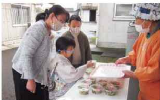
女性部会員から七草粥を受け取る児童