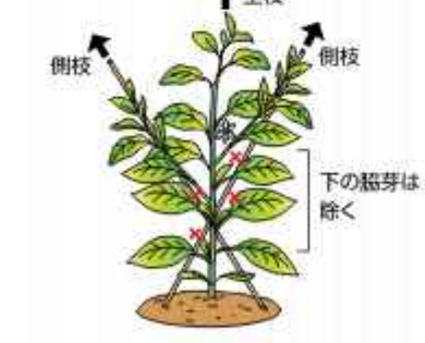
栽培カレンダー(ピーマン)