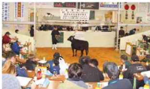
多くの購買客が集まった子牛初せり

またせり場の前では、当JA女性部・購買課が手作りのからいも餅や、温かい飲み物などを販売。生産者の方々に大変喜ばれました。