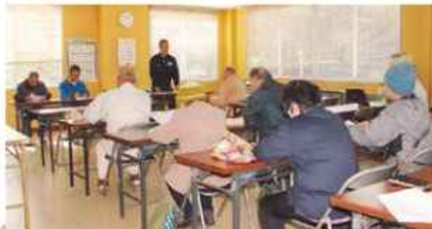
出荷状況を確認する参加者

令和6年産は1月下旬から2月中旬に収穫。1ヶ月間貯蔵し、3月上旬から約20トンの出荷を計画。系統市場やふるさと納税など県内や九州各地へ販売予定です。