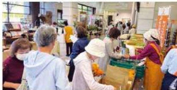
多くの来場者でにぎわう青空市

来場者からは「野菜や果物の値段が高騰している中、安くて新鮮な品物がたくさんあって嬉しい」と喜びの声が多く聞かれました。