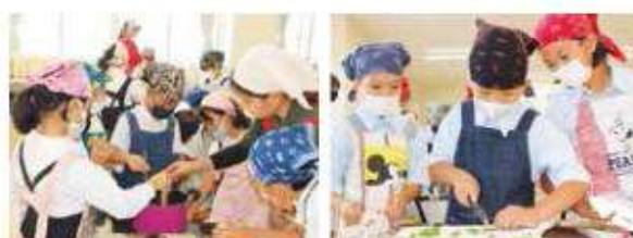
大豆を煮込む児童