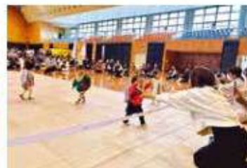
吹上 かけっこレース