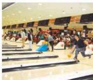
プレーを楽しむ参加者