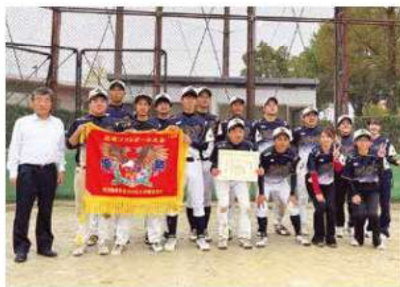
3連覇を喜ぶ選手たち