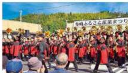
金峰 子どもたちのステージ