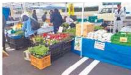
金峰 花・野菜販売