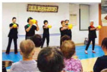
リズム体操を披露する出演者

同部会員による日本舞踊やリズム体操の披露、ギター演奏者による弾き語りなど工夫を凝らした内容で行われ、夜空に浮かぶ美しい満月を楽しみました。