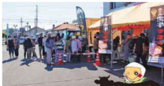
今年8月に開催した販売会の様子