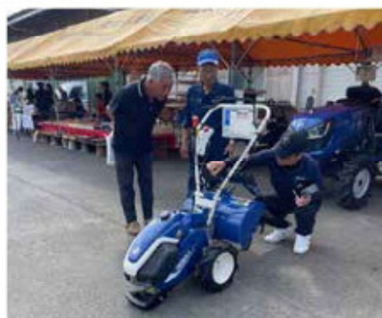
操作方法の説明をうける来場者

当JAは、地域農業の発展に貢献するため、今後もこのようなイベントを通じて、最新の農業技術や情報を提供していきます。