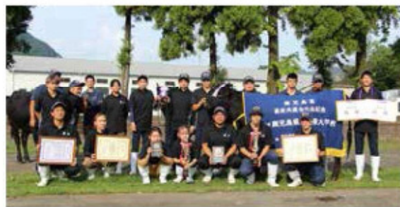
若雌2区最優秀賞3席 特別部位賞を受賞した 県立農業大学校