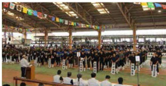
県畜産共進会 開会式の様子