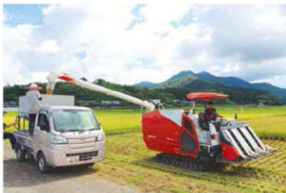
収穫したお米をトラックに積み込む様子