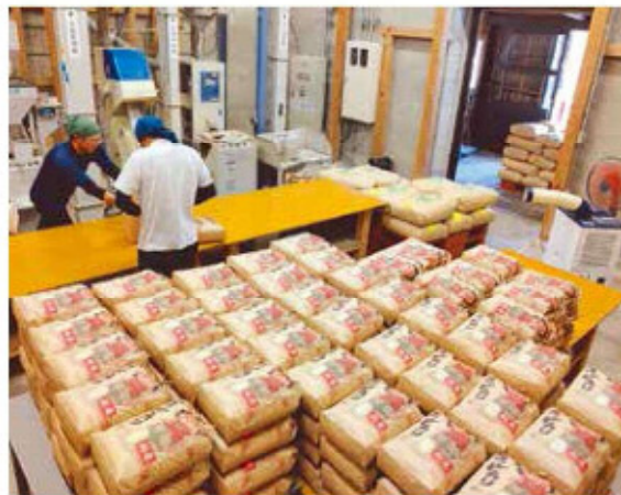
新米まつりの準備をする木花館職員

県内外から多くの来館者が訪れ、2日間で合計583袋を販売しました。また、新米の販売と共におにぎりの試食会も実施。金峰コシヒカリの粘りと甘みを堪能されていました。