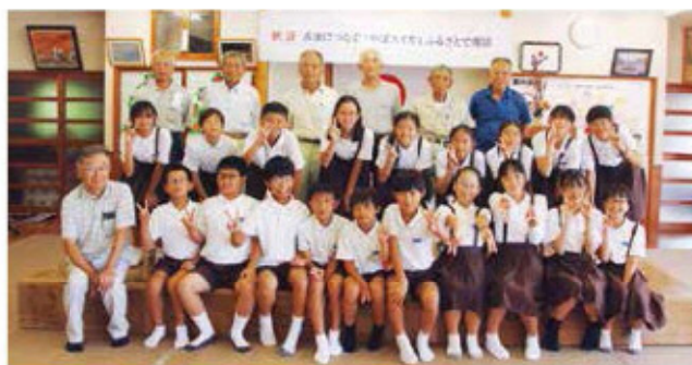
やぼスイカの復活を祝う地元農家と児童たち