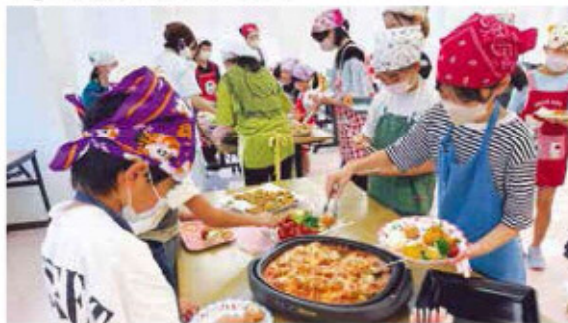
料理を盛り付ける子どもたち

調理の後は、自分で取って食べるパイキング形式で、食事マナーも学びながら、完成した料理を親子一緒に美味しく食べました。参加した児童は「お母さんやお友達とおいしい料理を作る事ができて楽しかった。夏休みにお家でも作ってみたい」と笑顔で話しました。