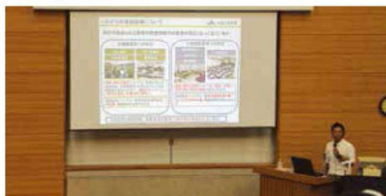
農大校生に想いを伝える西元営農指導員

生徒は「実際に話を聞くことで仕事の理解が深まり、営農指導員として働きたい気持ちが強くなった」と話しました。