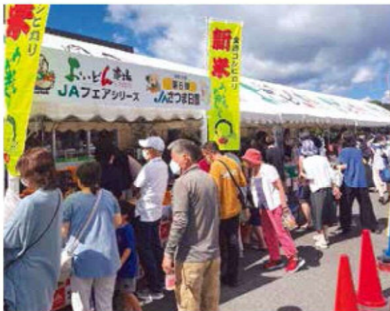
多くの来館者で賑わいをみせる様子

また、牛肉やハウスみかん、金峰コシヒカリなど豪華景品が当たる抽選会も行われ、多くの来館者で賑わいました。