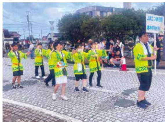
息のあった踊りを披露するJA職員

参加したJA職員は「始めは、踊りを忘れていたが、やっているうちに思い出し、最後はしっかりと踊ることが出来た。来年も参加し地域を盛り上げたい」と話しました。