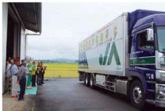
トラックを見送る関係者