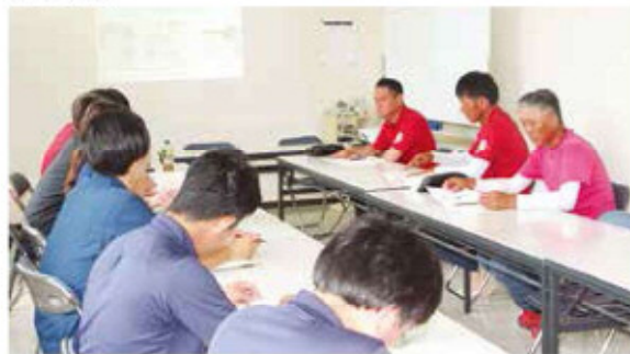
実演会に参加する青年部員・JA職員

また、出席した部会員から「圃場管理を効率的に行うため、「Z-GIS」の導入を検討したい」と話しました。