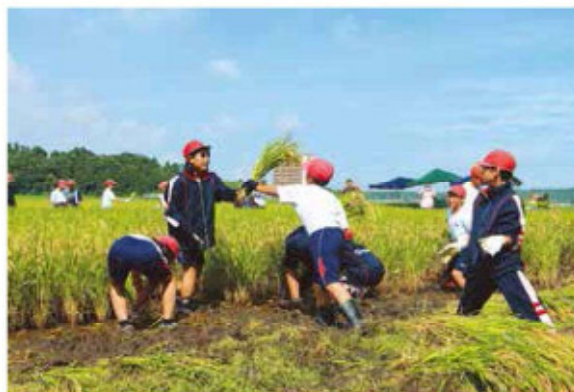
力を合わせて収穫する児童

児童は「稲穂が大きく育っていた。泥にはまって、鎌で刈るのは大変だったけど、とても楽しかった。早くおいしいお米を食べたい」と笑顔で話しました。